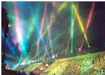
Sambódromo Rio de Janeiro - 2002

Iluminador responsável pela criação de efeitos , programação e comando da operação da Iluminação da Passarela do Samba – RJ por ocasião da inauguração da nova iluminação cênica com mais de 180 Moving Lights de grande porte 3KW e 800 projetores convencionais . Para a Peter Gasper Associados .