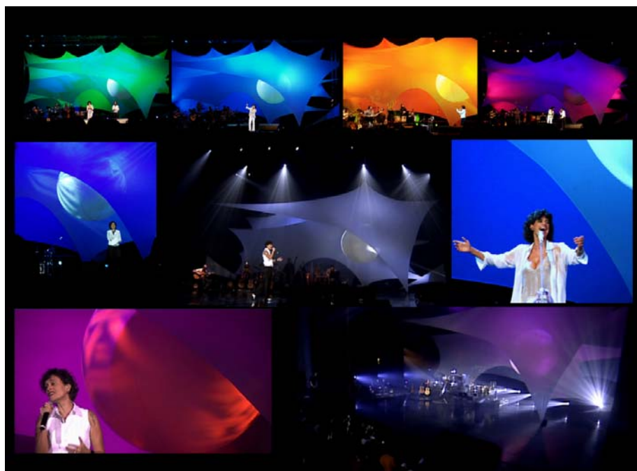
DVD – Amigo é Casa – Zélia Duncan e Simone – 2008

Direção de Fotografia e Projeto de Luz para vários DVDs entre eles : Zeca Baleiro e Fagner ; Jorge Aragão ; Martinália ; Xuxa Festa ; Xuxa Circo ; Isabella Tavianí ; Simone e Zélia Duncan entre outros .