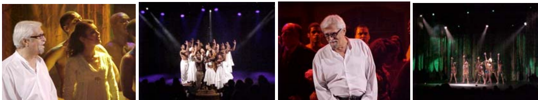
Al Ai Brasil – Sérgio Britto