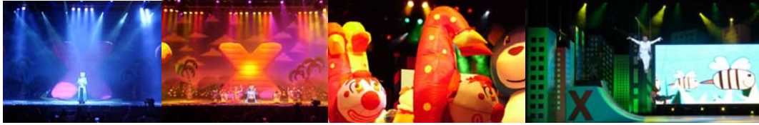
Xuxa Só Para Baixinhos - Xuxa Circo - Xuxa Festa

Membro das equipes de iluminadores de eventos como "Rock in Rio" , "Hollywood Rock" e "Free Jazz" trabalhando como iluminador para a Peter Gasper Associados. , IRIS Luminotécnica e Oficina de Luz .