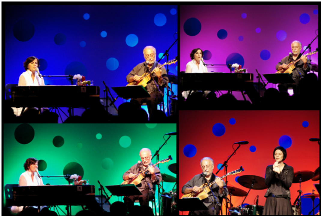
Leila Pinheiro e Roberto Menescal - Rival 2008